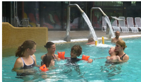
Spenden: Warmwasserschwimmen im Eugen-Keidel-Bad

▫ FED: Während der Sommerferien hatte die Mitarbeiter/-innen des FED gut zu tun in den Tagesbetreuungsgruppen. Wer zu Besuch kam, konnte sich von der guten Stimmung überzeugen, die auch in den beiden 15tägigen Freizeiten herrschte.