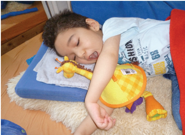
Tierdressuren mit Tayeb